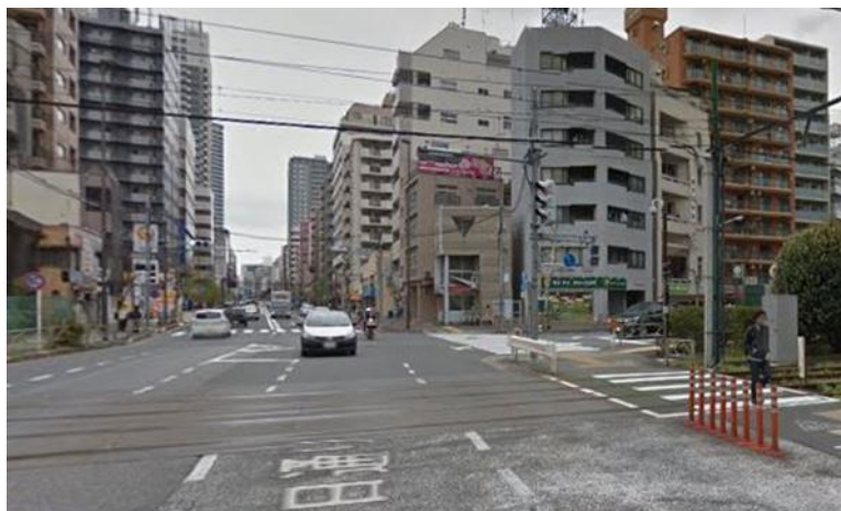
図 1-1 向原踏切と国道 254 号

都電荒川線を跨ぐ向原踏切は交通量の多い国道 254 号と交差しており、国土交通省により『歩行者ボトルネック、自動車ボトルネック、歩道が狭隘な踏切』に指定されている。なお、連続立体交差事業を行うケースでは、向原踏切に隣接し、都道 435 号と交差する東池袋踏切を取り上げた。