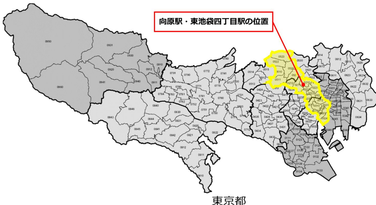
図 5-3 分析対象の地域