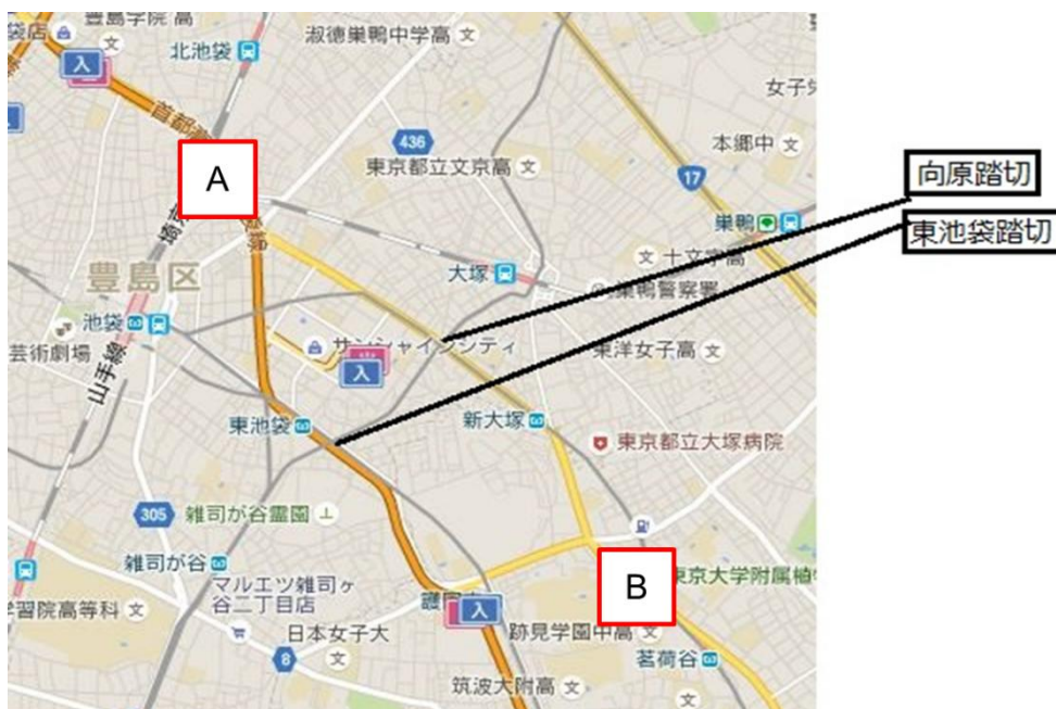
図 5-2 分析対象の道路

本節で政策の導入により配分交通量に影響があると考えられる地域を設定する。今回分析で扱う向原踏切を通る国道 254 号（春日通り）と、東池袋四丁目踏切を通る都道 435 号を通るトリップに焦点を当てる（図 5-2）。表 5-2 において、A 地点から B 地点までのトリップにおいて利用される主な道路を国道 254 号と都道 435 号と考え、この二つの踏切の有無によって影響を受けると予想される地域（踏切が位置する豊島区以外に板橋区、練馬区、文京区、新宿区、千代田区、中央区を含む）に分析の対象を限定する。本分析で扱った地域は図 5-2 において黄色で示された範囲である。