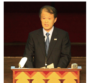
竹歳誠氏 国土交通事務次官

プログラムと講演者は以下のとおりです。講演記録や資料を http://www.pp.u-tokyo.ac.jp/ERES/index.html で公開していますので、ぜひご覧ください。