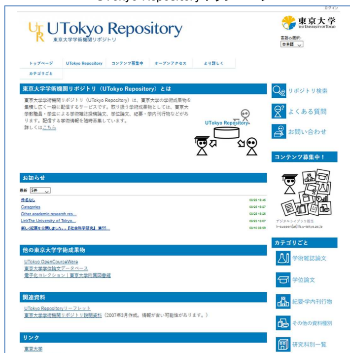
UTokyo Repository トップページ

( https://repository.dl.itc.u-tokyo.ac.jp/ )