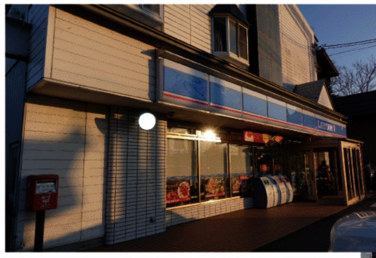
村内のコンビニエンスストア