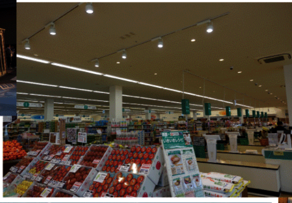
飯山駅前の大きなスーパー