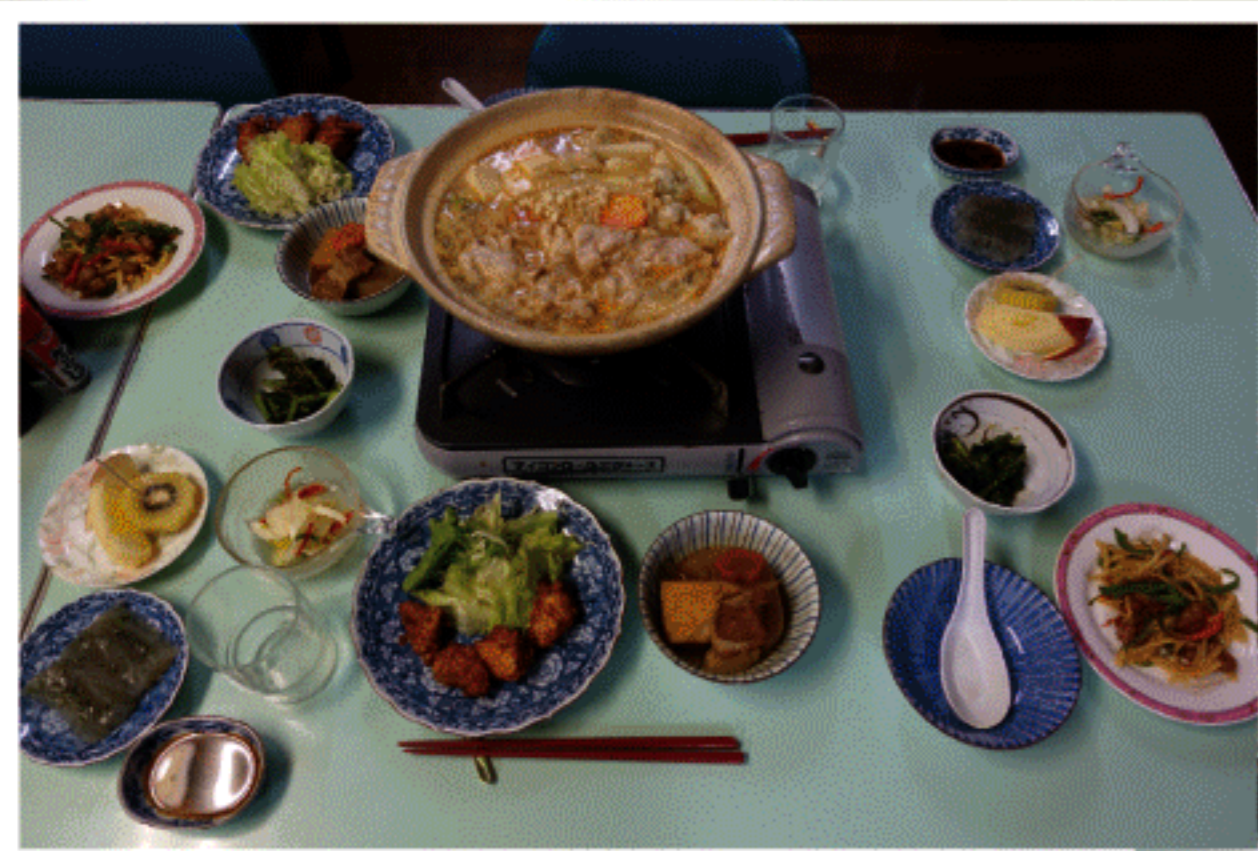
民宿の場合の夕食 (例)