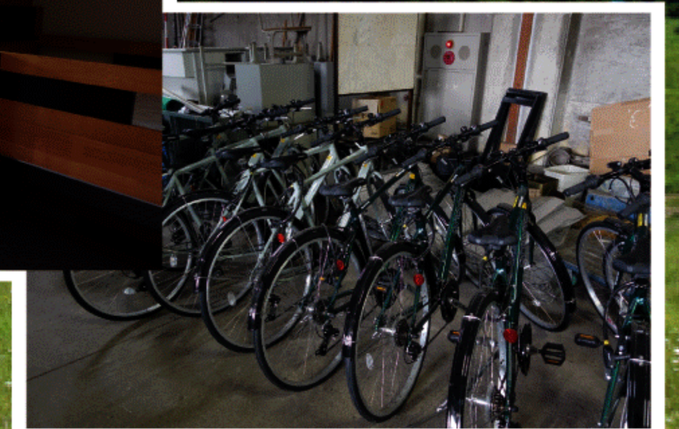
農村交流館貸出用自転車