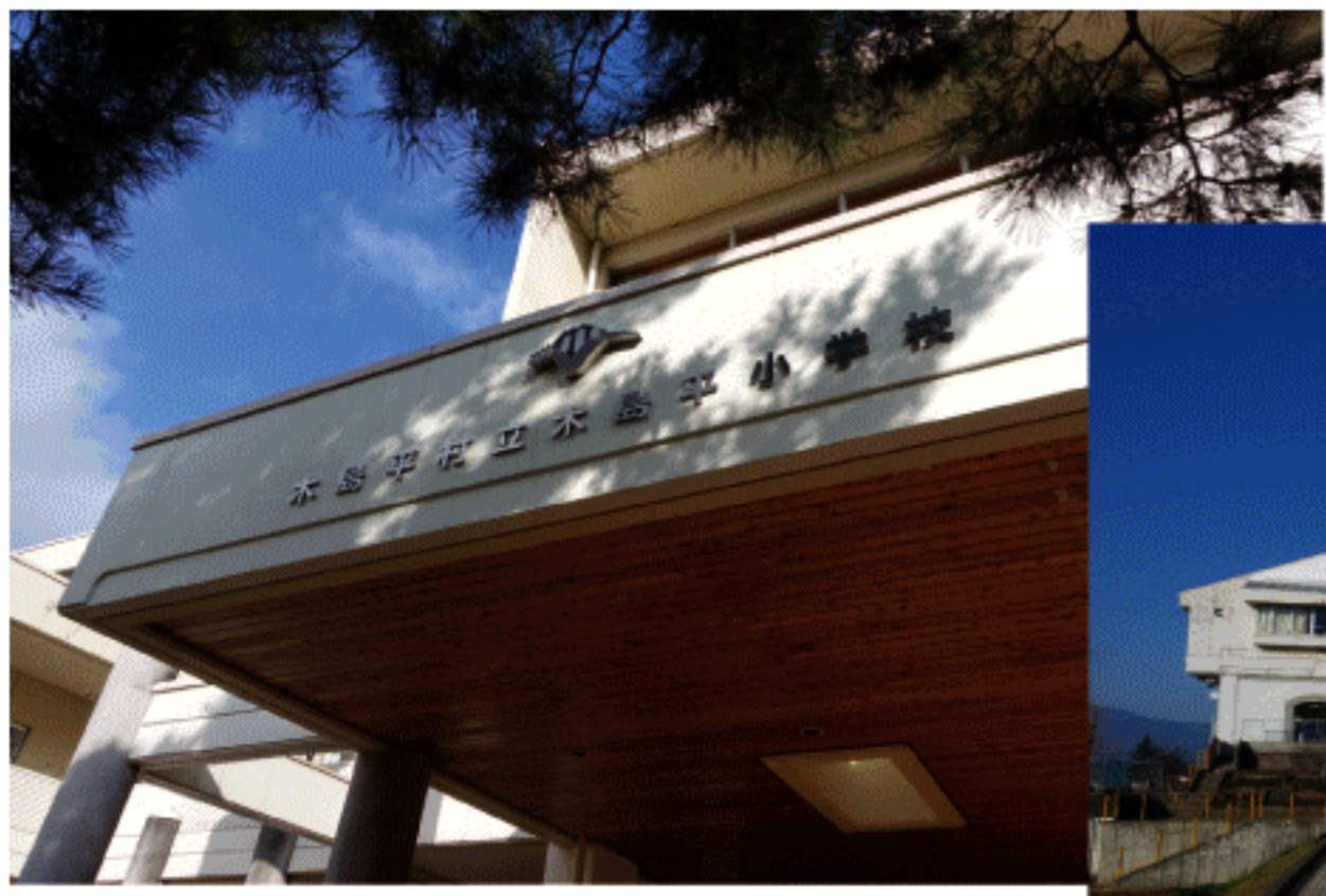
木のぬくもりが感じられる 木島平小学校