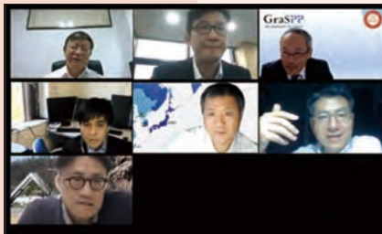
第2回公共政策トークの様子