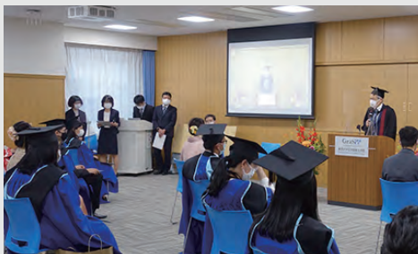
2021年度秋季学位記授与式の様子

公共政策学教育部2021年度秋季学位記授与式が、9月24日に国際学術研究棟SMBCアカデミアホールで開催され、49名の学生に学位が授与されました。