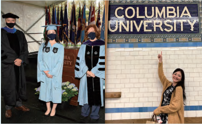
▲写真だけの卒業式