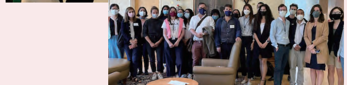
↓ Fox International Fellowship at Yale University