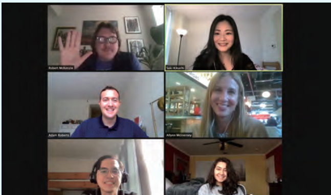
キャブストンのチームメンバーと

最後に、貴重な留学の機会を与えてくださったGraSPPの皆様、出願から渡航まであらゆるサポートをくださった留学課の皆様、多大な金銭的支援をくださったNSK奨学財団様、快く送り出してくれた家族に、心から感謝の意を表します。ありがとうございました。