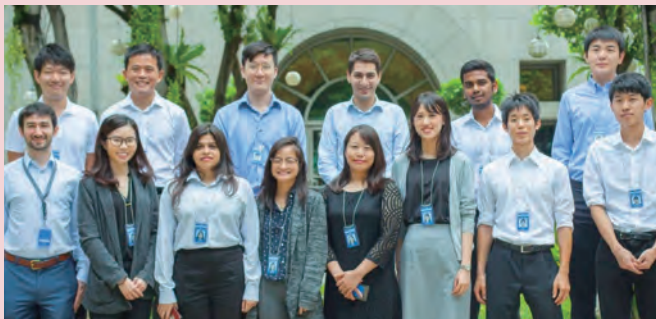
ADB Research Internship

I am currently visiting Yale University conducting my research through the Fox International Fellowship. The takeaways from studying abroad are the exposure to up-to-date research trends and build influential networks. This research-oriented program allows me to utilize various research resources and obtain feedback on my research from exceptional scholars. I have been exploring as many benefits as I can absorb by attending the development-related courses and workshops and connecting with scholars from all around the world. I believe that this opportunity will lead me to grow as a better researcher with sophisticated analytic skills and a serious attitude in pursuing academic growth.