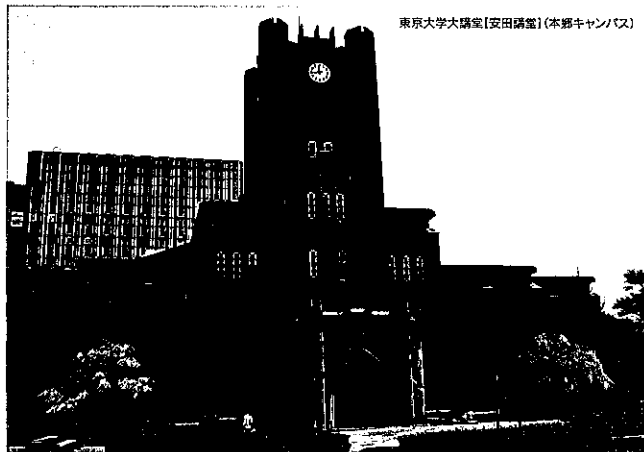
東京大学大講堂[安田講堂] (本郷キャンパス)

●申込方法 申込書に必要事項をご記入の上、お申し込みください。 パンフレット・申込書は、120円切手を同封の上、下記までご 請求ください。ホームページからもダウンロードできます。 ※当日参加も可能ですが、定員に達した場合にはお断りする こととなります。