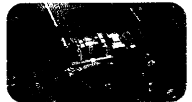
写真：IEL Greenwich Campus Charlton House(英国・ロンドン市内)

春期集中コースでは、言語学、日本語学、日英語対照研究、教授法、教育実習により構成されたカリキュラムにおいて、日本語教師として身に付けておくべき基本的知識と技術を習得します。教育実習はヨーロッパ圏の実際の日本語学習者を対象に行われます。