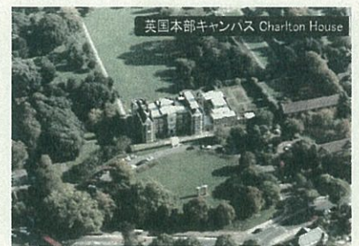
英国本部キャンパス Charlton House

英国国際教育研究所は、英国に本部を置く国際教育研究機関です。日本語の国家統一試験を実施する英国の公的試験センターとしての活動や、学会の本部として総会ならびに研究発表大会の開催、研究紀要や会報の刊行等の活動を行なっています。また、外国語教員資格を授与する大学院大学として機能しています。加えて、当研究所は、英国グリニッジ大学の日本語科を担当しています。