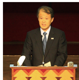
竹歳誠氏 国土交通事務次官

プログラムと講演者は以下のとおりです。講演記録や資料を http://www.pp.u-tokyo.ac.jp/ERES/index.html で公開していますので、ぜひご覧ください。