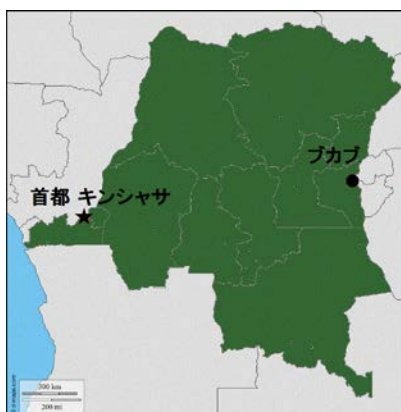
コンゴ民主共和国

監督：ティエリー・ミシェル／作者：コレット・ブラックマン、ティエリー・ミシェル／脚本：ティエリー・ミシェル、コレット・ブラックマン、クリスティーヌ・ピロ／ 編集：イドリス・ガベ／製作：ティエリー・ミシェル／2015 年／112 分／原題：L'HOMME QUI REPAIRE LES FEMMES／字幕：八角幸雄／監修：米川正子 後援：特定非営利活動法人アフリカ日本協議会、公益社団法人アムネスティ・インターナショナル日本、女たちの戦争と平和資料館、日本アフリカ学会関東支部、 日本学生平和学プラットフォーム、ヒューマン・ライツ・ウォッチ、ビジネス・人権資料センター、認定 NPO 法人テラ・ルネッサンス、毎日新聞社 当映画上映会は、アフリカ協会、大竹財団と国連広報センターから資金協力をいただいています。 総括：コンゴの性暴力と紛争を考える会