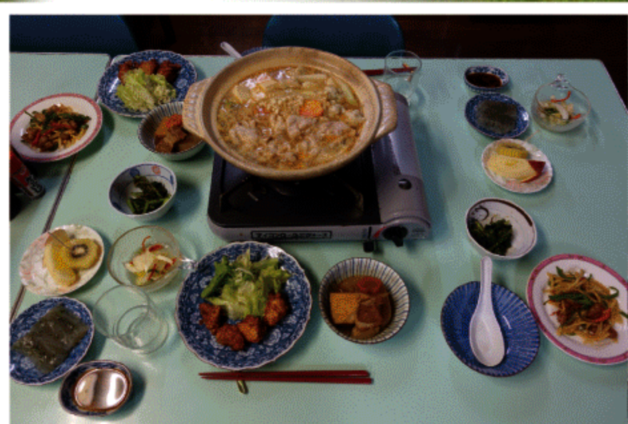
民宿の場合の夕食 (例)