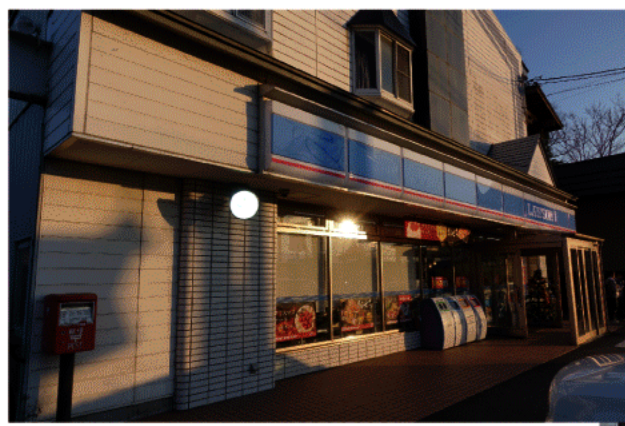
村内のコンビニエンスストア