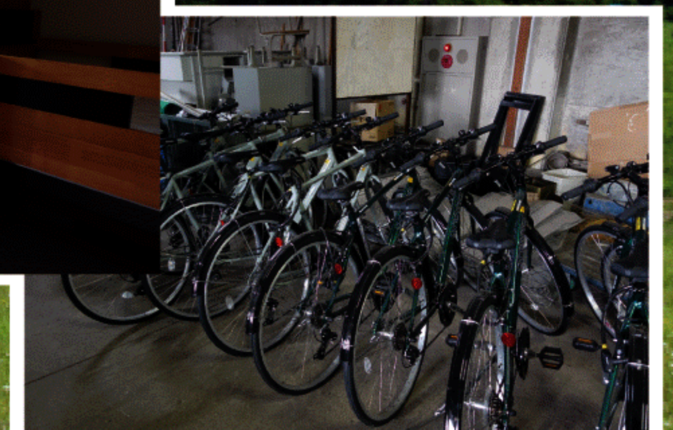
農村交流館貸出用自転車