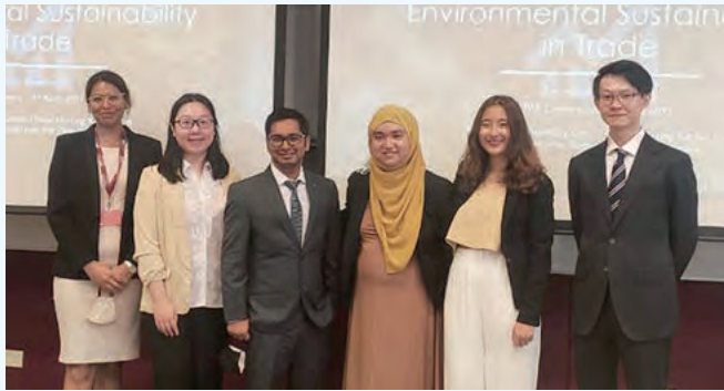
With my team at the PAE Conference

My experience of the Double Degree program with LKYSP National University of Singapore (July 2021 - May 2022) during the COVID-19 pandemic began with a three-week self-isolation at a five-star hotel upon my landing at Changi airport. My first impressions of Singapore, naturally, were somewhat off-kilter, having faced stringency and luxury intertwined in a strange, dystopian sort of way. But, my final evaluation of my year in Singapore lies close to that of my first three weeks in the country. My experience, despite the academic rigor and stringent COVID restrictions, was immensely rewarding and gratifying, peppered with special highlights of friendship and travel.