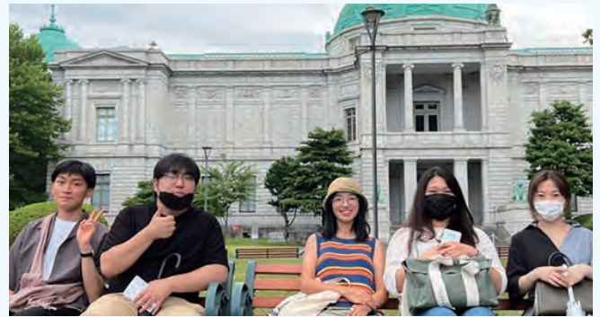
Fieldwork trip with my classmates

When I imagined my study abroad in 2019, I had naive rose-colored dreams of traveling the world, wasting time on hobbies, making friends, and getting precious respite before entering society. When I was accepted to the double degree master's program offered by Sciences Po and the University of Tokyo, I wasn't expecting COVID-19 to come into the way. I was disappointed at first, thinking how much I would miss during the pandemic. Then I decided not to dwell on my loss, but to make the most of the experience and learn as much as possible.